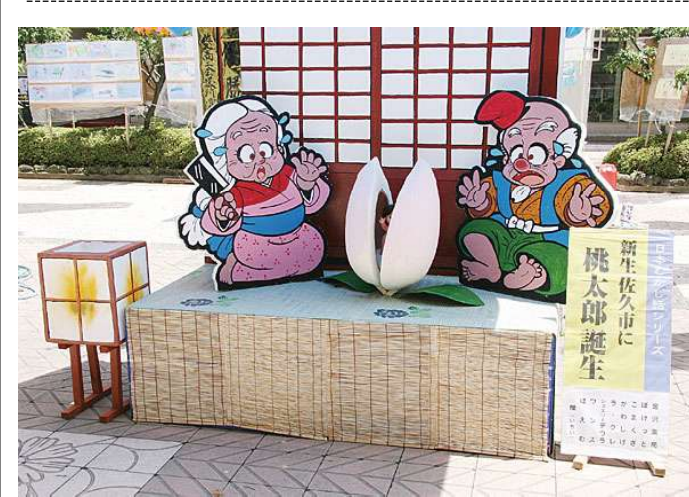
昨年のコンクール参加作品「桃太郎誕生」 ショプエイト・ガル製作

古く歴史から最新情報まで、中込のことならお任せです。 コンクール参加者にはもうひとつのメリットが七夕飾りでお祭りを盛り上げていただける御礼として、様々なアピールの場所を提供いたします。