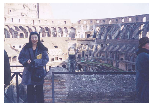
ローマ コロシウムにて