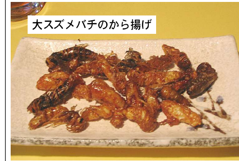
大スズメバチのから揚げ