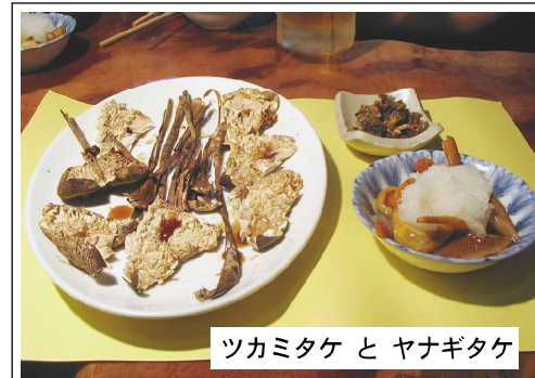
ツカミタケ と ヤナギタケ