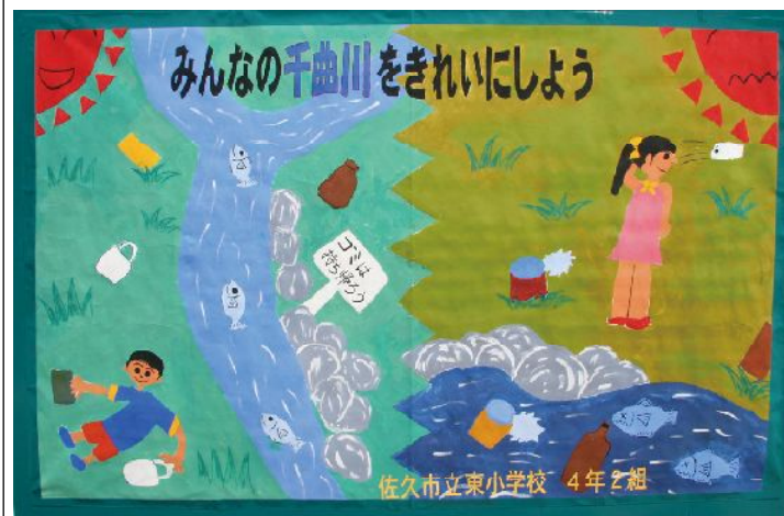
東小学校4年2組の作品「千曲川をきれいな川に」

◇ 出店募集中 ◇ グリーンモールの今後の予定は10月6日・11月3日・12月1日と続きます。商品の販売以外にもグループの発表の場としてご利用下さい。テントや机など、必要な物も用意できますので、お気軽に商店会事務所にお問い合わせください。