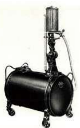
可搬式ガソリン計量器

ご存知のように、ガソリン価格の変動は世界中の経済が大幅に影響してわたしたちの生活をも脅かすこともありま。ちよつと前にはガソリンが1リットル180円代まで上がったのは、まだ記憶に新しいと思います。さて、そんなガソリンのお話から。 ガロンという単位を聞いたことがありますか。ガロンとは、ヤード・ポ