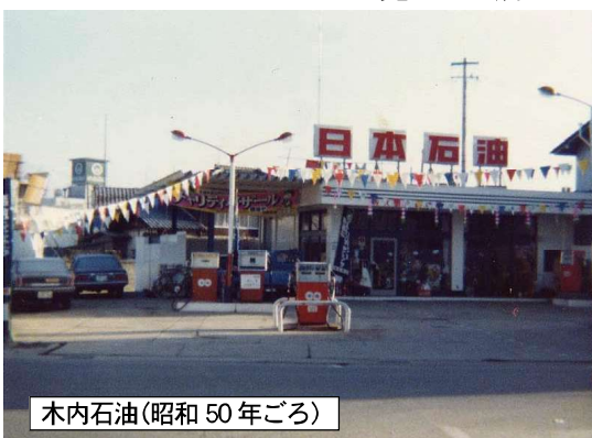
木内石油(昭和50年ごろ)

ンド法の容積の単位で、英国の1ガロンは5.546リットル、米国の1ガロンは3.785リットルです。一般的には、米ガロンを言います。なぜこんな話をするかと言いますと、当店が油屋を始めたばかりの頃は、ガソリンをガロン単位で販売していたからです。当時の帳簿が残っていないので正確な時期はわかりませんが、たぶん昭和28年か29年頃だと思えます。 計量機は「可搬式ガソリン計量機」で、タンクにドラム缶3本分しか入らないものでした。(写真参照) なつかしいな 店員さんが丸いハンドルを回している姿を良く見