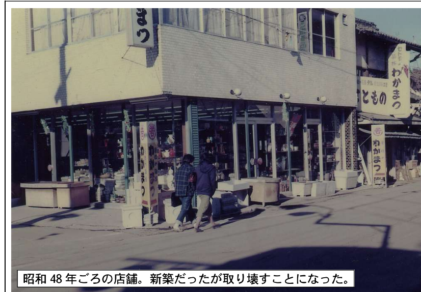
昭和48年ごろの店舗。新築だったが取り壊すことになった。