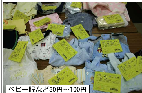
ベビー服など50円~100円

く二千元という値段で何点も出ています。入場整理券は10時から入場整理券は10時 危険防止と割れ物などの安全確保のために入場制限をしております。入場整理券は開場1時間前ですが、お一人1枚ずつです。「家族の分・友達」の分として余分に差し上げることができませんのでご理解ください。なお、小学生未満のお子様は不要です。 マイバッグ持参でゴミの減量と資源保護のためにレジ袋