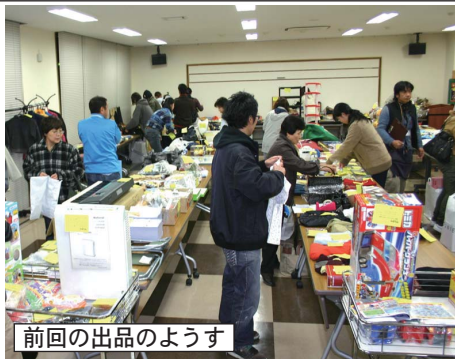
前回の出品のようす

もってえねえ市 の出品方法や出品禁止の物など、詳しいことはホームページ上にありますが「ネットなんて面倒くさい」という方のために、まとめてご紹介いたします。 初めての出品 18歳以上の方なら誰でも出品できますが、最初だけ運転免許証or保険証orパスポートなど本人確認ができるものをご持参ください。佐久市在住などの制限はありません。また免許証などをコピーする必要もありません。その場で拝見してすぐに返します。