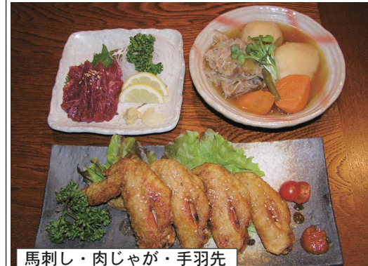
馬刺し・肉じゃが・手羽先