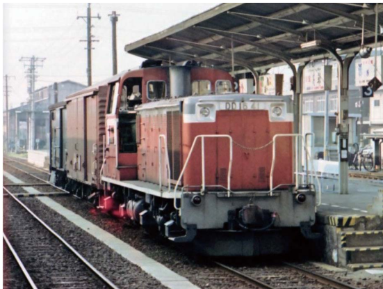
本物のDD16(昭和58年8月5日 中込駅にて)

中込商店街のお得情報・お役立ち情報をお届けします。 今回は4月30日(土)に新聞折込に入ります。 本紙ネット版も商店会サイトに掲載しています。