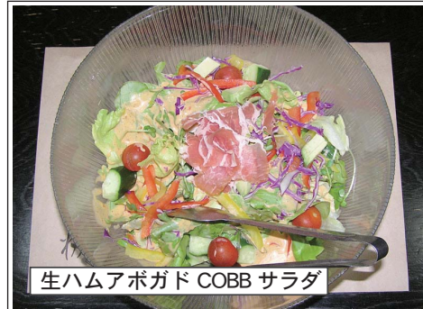
生ハムアボガド COBB サラダ