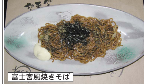
富士宮風焼きそば