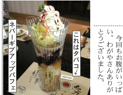
ネバギブアップパフェ