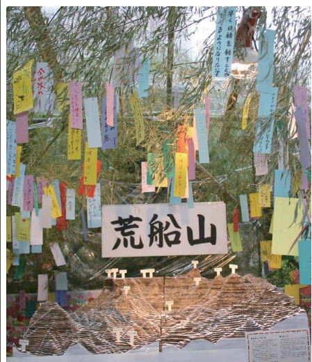
昨年の出展のようす。この荒船山もバージョンアップしているとか…。

七夕に出展 内山キラキラプロジェクト 今年も「内山を紹介するブース」を出展いたします！ 毎年、内山にちなんだ事を、楽しくご紹介しています。今年もぜひ、見に行ってくださいね。 場所は、中込銀座グリーンモール、せせらぎのある通りです。 ブースには笹竹を取り付け、内山や周辺の皆さんに書いていただいた「願い事の短冊」を飾ります。あらかじめ書いていただいたものを飾りますが、さらにお祭り当日にも、ブースの所で書いて竹に飾っていただけます。 ☆内山峠養蜂園特製はちみつ