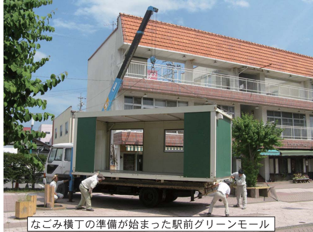
なごみ横丁の準備が始まった駅前グリーンモール

中込商店街のお得情報・お役立ち情報をお届けします。 今回は8月25日(木)に「なごみ横丁」を特集します。 本紙ネット版も商店会サイトに掲載しています。