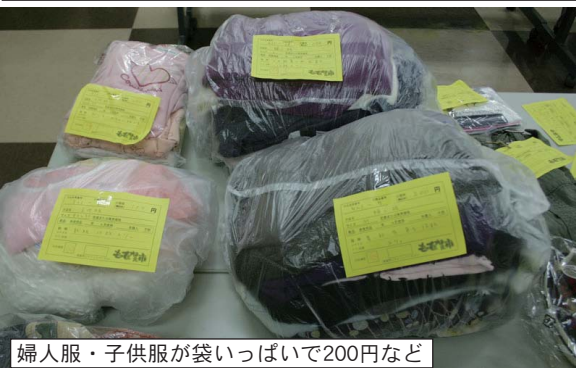
婦人服・子供服が袋いっぱい200円など

レゼントは、いつものように入場直前です。お楽しみに！ 手づくりクッキーのプレゼントは、いつものように入場直前です。お楽しみに！