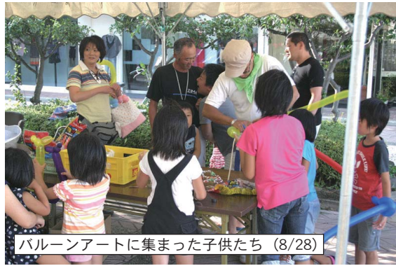
バルーンアートに集まった子供たち (8/28)

8月25日から始まった「なごみ横丁」は若者でもなんとなく懐かしさを感じるレトロなセッティングと、雑多で活気あふれる会場の雰囲気誘われて大勢のお客様で連日にごわっています。 平日：午後5時〜9時半 土曜：正午〜午後9時半 日曜：正午〜午後8時