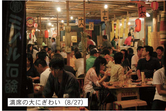
満席の大きいわい (8/27)