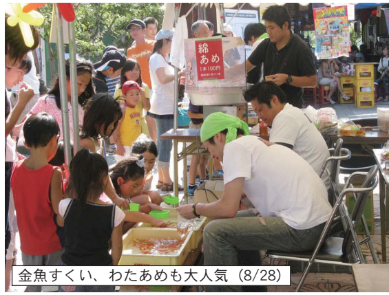
金魚すくい、わたあめも大人気 (8/28)