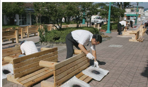
絵の型板を当ててスプレーで絵付け

中込商店街のお得情報・お役立ち情報をお届けします。 次回は9月24日(土)に創刊300号記念プレゼント特集です。 本紙ネット版も商店会サイトに掲載しています。