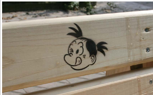
ベンチにあんずちゃんの可愛い絵が付きました

間伐材を利用したベンチが勢揃い 長野県地域発元気づくり支援金を活用して作製されている「間伐材を利用したベンチ」は、先週6日に中込中学校3年生のご協力により35台組み立てたのに引き続き、9日の水曜日には20名を超える商店会メンバーの手によって防水塗装が施され、グリーンモールの30台が勢揃いいたしました。