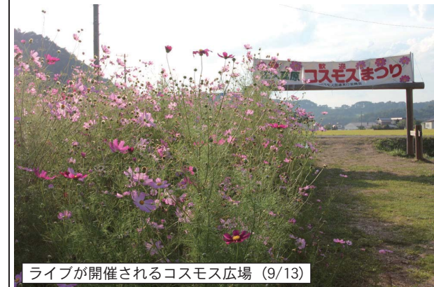
ライブが開催されるコスモス広場 (9/13)