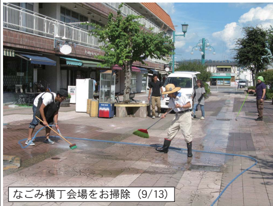
なごみ横丁会場をお掃除 (9/13)

この大震災を契機に、分かち合い・支え合いこそが幸せな世界をつくるための本當の基盤なのだ...という認識も、また大きな潮流となりつつあるのを感じます。