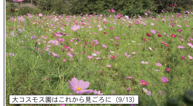
大コスモス園はこれから見ごろに (9/13)

「手と手をつないで、一つの心」コスモスライブ2011 コスモスの花咲く広場で、音楽やダンスのライブ！ 日時：9月18日(日) 12時30分~16時30分