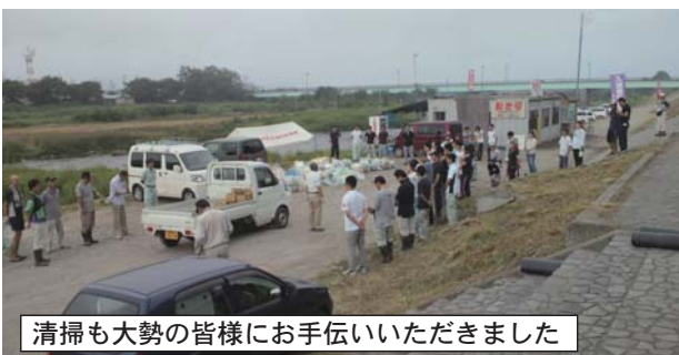
清掃も大勢の皆様にお手伝いいただきました

2013 佐久千曲川大花火大会 無事に開催 今年8月15日の花火大会の日に、諏訪では豪雨、京都府では大きな爆発事故があったということもあり、当地の花火大会はほとんど雨も降らず、事故もなく開催できたことに、ホッとすると同時にご協力いただいた各組織の皆様へ深く感謝申し上げます。 稲妻にも拍手 開会式にポツポツと雨が降り始め、プログラムを早めに進めようとしたのですが、その後は最後の花火まで降らず、予定通り打ち上げることができました。夜空に稲妻が走り、大きな雷鳴が響くこともありましたが、ノリの良いお客様から花火と同じように歓声が拍手が起きていました。 後片付けにも大勢が 花火大会の翌朝6時から市役所や佐久商工会議所職員の皆様、地元飲組合や商店会役員、ボランティアの皆様など大勢が参加して清掃作業を行いました。皆様ありがとうございます。(関連のフोटコンテストの記事は3面) 露店屋台は成田公園にも 中込側堤防通りの安全を確保するために、イベント組合の皆さんと協議し、警察からのご指導もあり、成田公園通りを歩行者天国にして、この通りと公園内に多くの露店屋台が出店しました。結果的には混雑が分散して、より安全になったと思えますがいかがだったでしょうか。