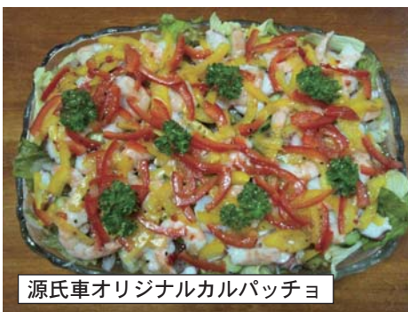
源氏車オリジナルカルパッチョ

庖丁研ぎ承ります 庖丁、彫刻刀(ハイス鋼)、園芸刃物、ナイフ、鉋なども取り揃えております。また国産のフライパン・鍋も取り揃えております。 刃物金物部 丸正商店 サンテラス ☎ 62-0369