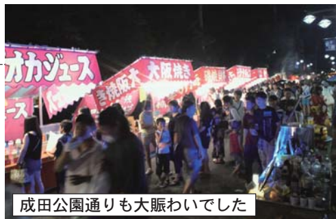
成田公園通りも大賑わいでした