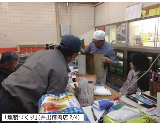
「焼製づくり」(井出精肉店 2/4)

中込商店街のお得情報・お役立ち情報をお届けします。 来週は2/15(土)に新聞折込みに入ります。 本紙ネット版も商店会サイトに掲載しています。