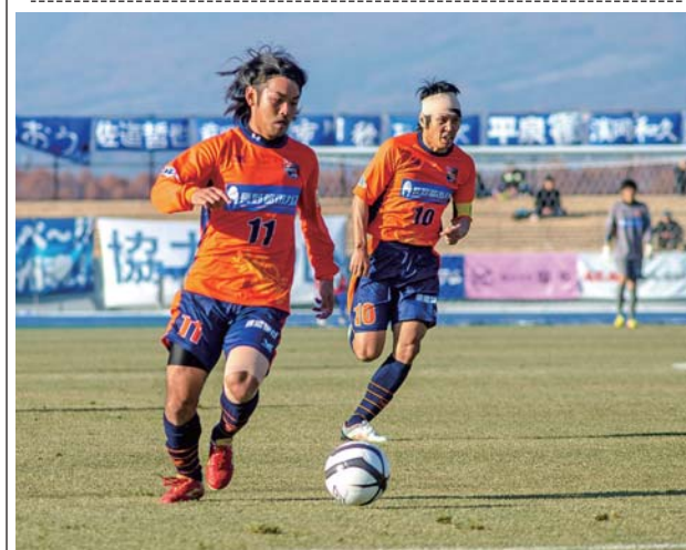
昨年の最終戦より(11/23 花岡直樹さん撮影)