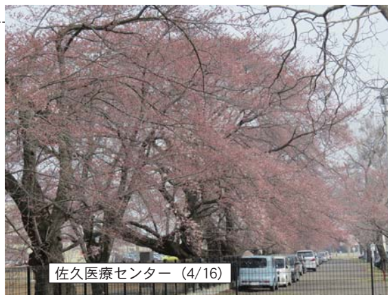
佐久医療センター (4/16)