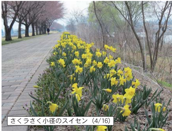
さくらさく小径のスイセン (4/16)

北中込駅 ホームの可愛い待合室と桜で「鉄」(鉄道マニア)にも人気の北中込駅も、少し咲き始めています。 茨城牧場長野支場 種畜牧場と言った方が分かりやすいでしょうか。花見の名所ですがまだ咲いていません。 五稜郭 お堀にかぶさる桜がきれいです。ちよつと咲き始めたところです。