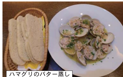
ハマグリバター蒸し