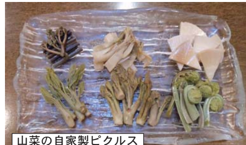
山菜の自家製ピクルス