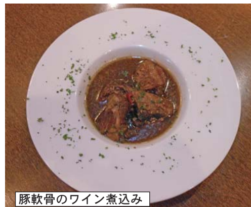
豚軟骨のワイン煮込み