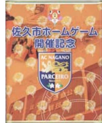
パルセイロドロップ