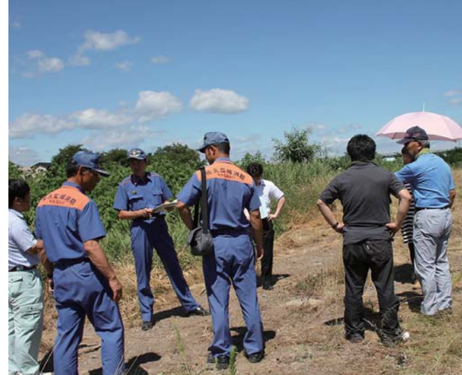
消防本部による花火会場の検査(8/6)

金曜日開催中 10月まで毎週金曜日に開催します。会場は橋場公会堂で、午後2時～4時まで。 地元でとれた野菜などがほとんど100円均です。 8月12日(火)に営業し、15日(金)は休みです。