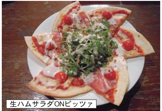
生ハムサラダONピッツァ

毎日暑い日が続いてますね。本紙はお盆休みの都合で8月11日に印刷していますが、みなさま花火大会はお楽しみいただけただけでしょうか。 役員達も連日作業で体力に余裕がなくなつてきているように感じています。 我が隊員の一人が「こんな時ほどゆつたりまつたりしたいよね」と言っている、「そうだ！隠れ家のいいお店知ってるんだ。おんラインさん