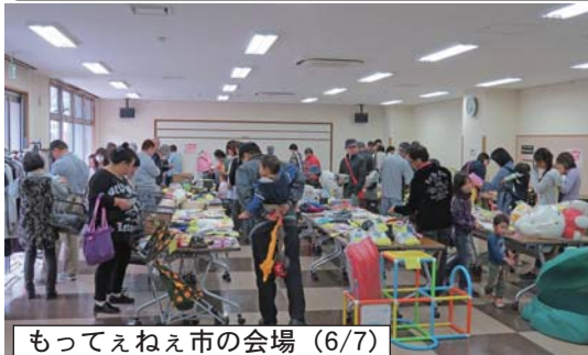
もってえねえ市の会場 (6/7)

中込商店街のお得情報・お役立ち情報をお届けします。 来週は8/24(日)に「まちゼミ」のチラシをお届けします。 本紙ネット版も商店会サイトに掲載しています。