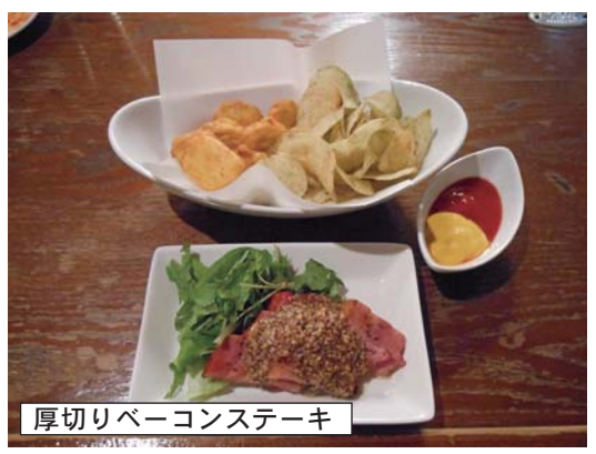
厚切りベーコンステーキ

ーブルに持ってきてくれる「毎日変わるお通しは6品あつて好きなものを選んで頂けますよ。チャージ料で600円なんです。仲間に来て時などは一品づつ頼んで皆で楽しんでもらえる様にしてあるんですよ」そうすると隊員の一人が「それに来た時の気分が好きなのを選んでるのは楽しいですよ。女性なら喜んじやうな。だってヘルシー的なものだったたり、ガッツリ系だったり、フルーツだったり