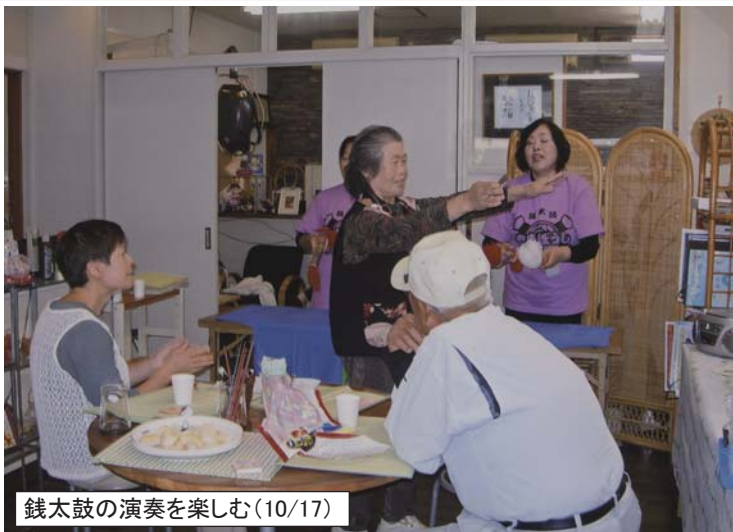
銭太鼓の演奏を楽しむ(10/17)