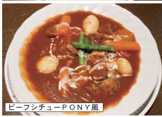
ビーフシチューPONY風