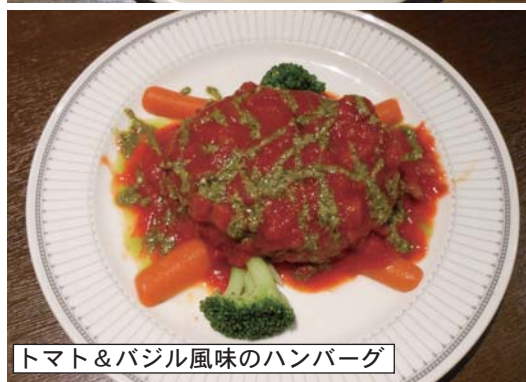
トマト&バジル風味のハンバーグ