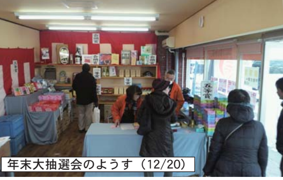
年末大抽選会のようす (12/20)

抽選会の会場としても使用した「中込駅前ふれあい処ほんわ館」は地域コミュニティの井戸端のように、いつでも気軽に集まれる場所として活用していただくことを目的にしています。 最大で20人ぐらいの会議や勉強会などに使える小さなスペースです。商店会でいつものイベントをやっているわけではありませんで、地域の皆さまにご活用ください。 平日夕方自習室 以前、カム1に中込学習センターがあった