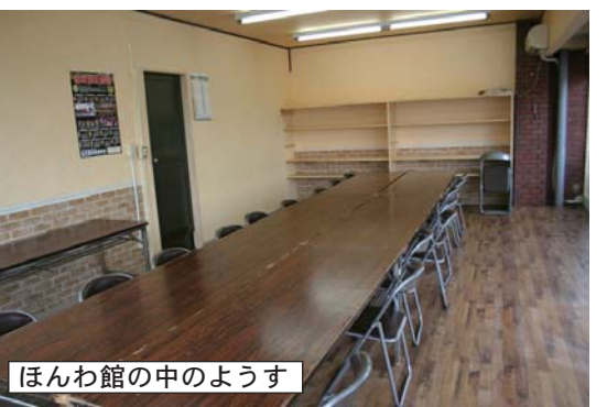
ほんわ館の中のようす

時には、帰宅途中や列車の時間待ちなどに高校生が大勢利用していました。 ほんわ館も月曜(金曜)の午後5時~10時は自習室として自由に(予約不要・無料で)使えます。 あくまでも自習室ですから、飲食や大声での私語は禁止です。マナーを守ってご利用ください。