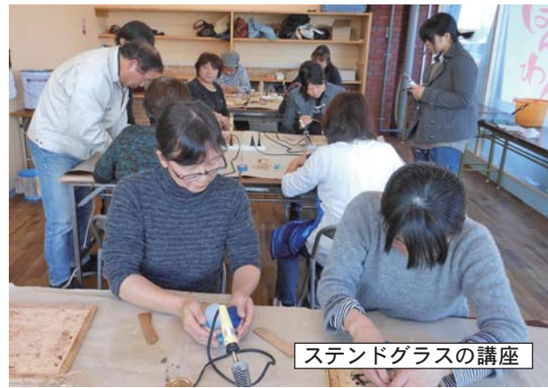
スタンドグラスの講座

今年度第1回まちゼミ 昨年度は4回開催して大好評だった「得するまちのゼミナール」を今年も4回開催する予定です。 これは商店主や商店の取引先など、あるいは高校生や学校の先生など、様々なその道のプロや趣味の人が専門知識やコツなどを無料で提供する少人数制のゼミです。 原則として各店舗で開催します。お店や店主を知って