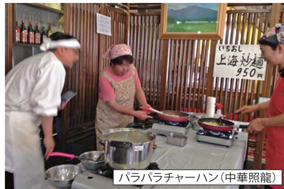
パラパラチャーハン(中華照龍)

中込商店街のお得情報・お役立ち情報をお届けします。 次回は11/8④に、まちゼミを特集します。 本紙ネット版も商店会サイトに掲載しています。