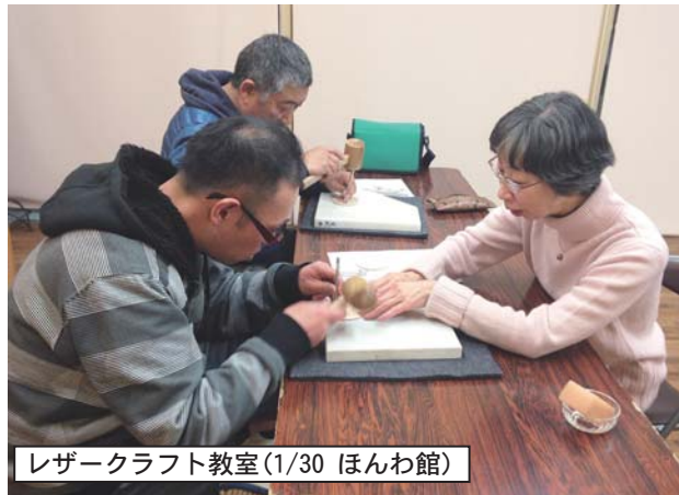
レーザークラフト教室(1/30 ほんわ館)