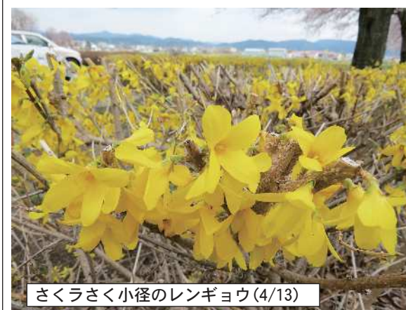
さくらさく小径のレンギョウ(4/13)

(1面からつづき) 成田公園は地元では花見 の名所で、今年も地元区で は4月17日に花見の会を予 定しています。 さくらさく小径 全長1.1kmのウォーキング コース。散歩やジョギングな どの運動には最適な場所。 早朝から歩いている人をた くさん見かけます。桜並木 は五分咲きぐらいいで、そろ そろ見ごろを迎えます。 またスイセン、レンギョウ も満開になっています。