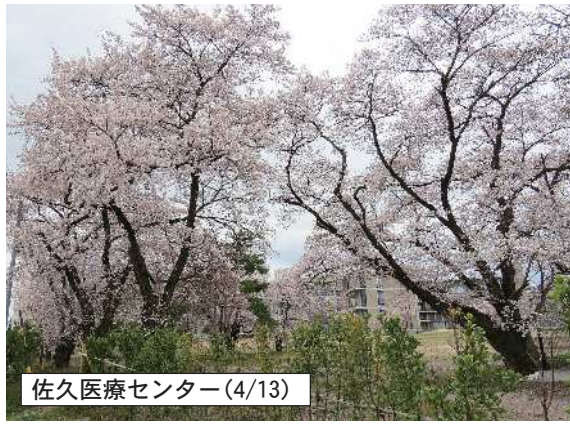
佐久医療センター(4/13)