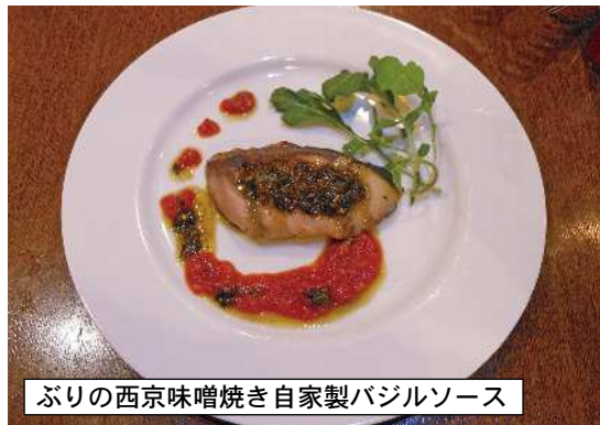
ぶりの西京味噌焼き自家製バジルソース

きのとうドレッシングのピッツァ(1200円)が運ばれてきました。みんな大好きなようにカットして頂くのですが、カットした先から口に入れていく食いしん坊な隊員ばかりです。「新玉ねぎだから甘いのにふきのとうで作ったある自家製のドレッシングがアクセントになっていて絶妙に美味しい。これならほとんど食べていっちゃおう」と瞬間に終わってしまいます。季節感が凄くあって何だか嬉しいですね。