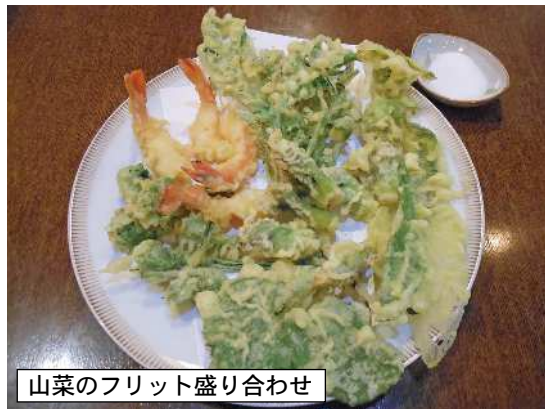
山菜のフリット盛り合わせ

はじめに運ばれてきたのはクレソンとささみのサラダ(720円)です。取り分けているのに、とっても分けた隊員はさすがに食べた後がたまらないと瞬間に終わっています。ささみも柔らかく女性好みですね。そうしているといくつ