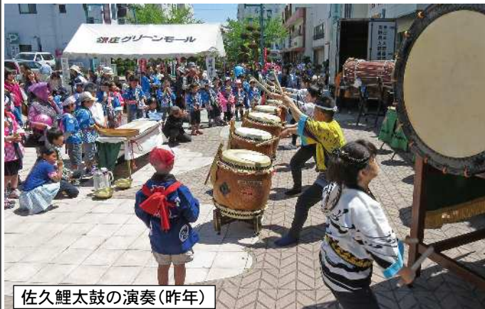
佐久鯉太鼓の演奏(昨年)