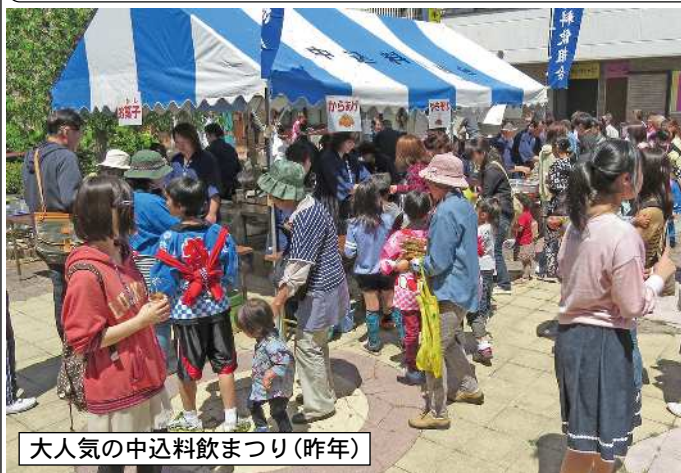
大人気の中込料飲まつり(昨年)

中込商店街のお得情報・お役立ち情報をお届けします。 次回は5/14㊤に新聞折り込みに入ります。 本紙ネット版も商店会サイトに掲載しています。