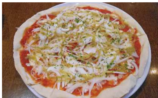
新玉ねぎとふきのとうドレッシングのピッツァ

お店に着くなり「生ください」と叫んでからメニューを見たり店内にお勧めのお料理を紹介されているのでそれを見ながら何を頼もうか悩んでいるのでその一人が店主さんに「今日の収穫のお勧めでお願いしたら?」と店主さんにお任せすることになりました。