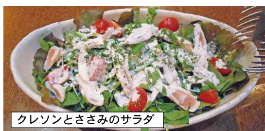
クレソンとささみのサラダ

隊員たちは季節を感じたいと思いつながりに行こうかと考えていると、一人の隊員が「ロックプールの店主さんは自ら山菜を採ってきてお店で調理してくれるんだよね。」