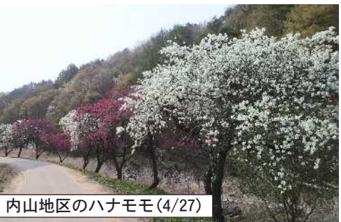
内山地区のハナモモ(4/27)