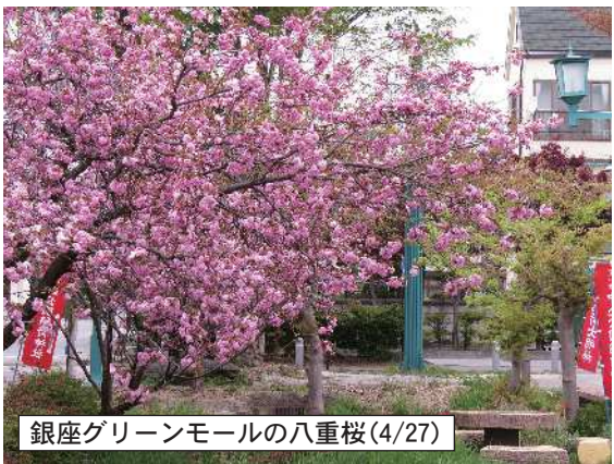
銀座グリーンモールの八重桜(4/27)