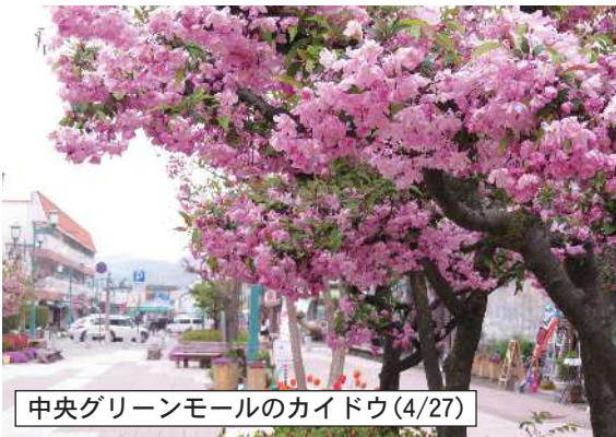
中央グリーンモールのカイドウ(4/27)