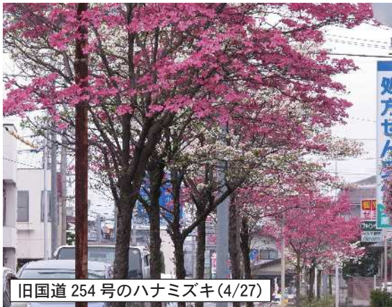
旧国道 254 号のハナミズキ(4/27)