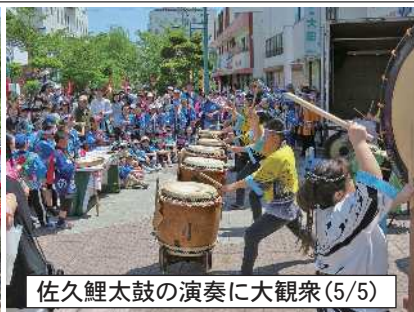
佐久鯉太鼓の演奏に大観衆(5/5)