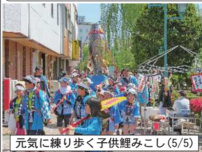
元気に練り歩く子供鯉みこし(5/5)

中込商店街のお得情報・お役立ち情報をお届けします。 次回は5/28(土)に新聞折り込みに入ります。 本紙ネット版も商店会サイトに掲載しています。