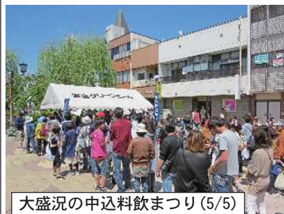
大盛況の中込料飲まつり(5/5)

次回のもてなえ市 会場：サングリモ中込 5/28(土) 夜7時～8時 出品受付 出品料は1品10円です 出品数制限はありません 6/4(土) 11時～1時 販売 1時30分～2時 出品者清算