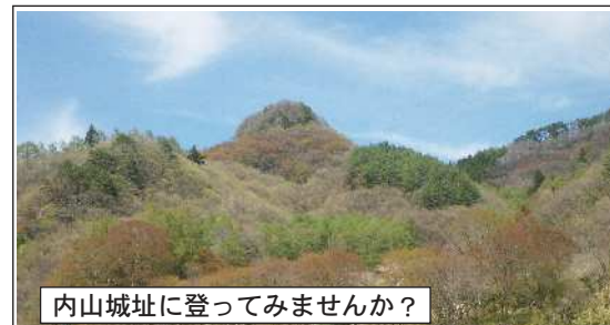
内山城址に登ってみませんか?

「内山城」勉強会のご案内 真田丸でも内山城がNHKテレビ「真田丸」にも、第9話で徳川と手を組んだ真田家と北条との戦の場として、最初に内山城の名前が出ます。しかし信繁(幸村)の妙案で、小諸で北条の補給路を断ち孤立させる戦術が奏功します。 そんな内山城について勉強してみませんか? ◆ ◆ 「内山城勉強会」地域の「宝」を知ろう!