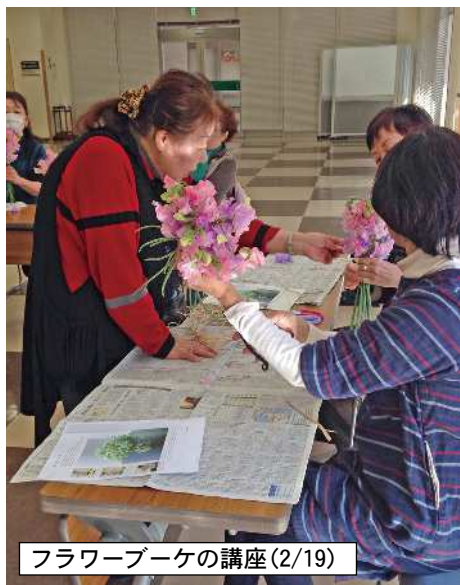
フラワーブーケの講座(2/19)

今年度も4回予定 昨年度のまちゼミも大変ご好評をいただき、「次はいつ?」「もうやらないの?」とお問い合わせをいただいていたのですが、県の元気づくり支援金事業に採択され、準備を開始いたしました。 6月12日から 6/12㊦のチラシで各講座の参加募集をする予定です。毎回大勢のご応募をいただき、手作りウインナー、塩ぶたづくりなどたくさんの方の講座を企画・準備しています。