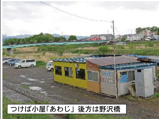
つけば小屋「あわじ」後方は野沢橋

ウグイの付け場漁 瀬付け漁とも言います。ウグイは産卵のためにきれいな砂利(小石)が敷きつめられた川床で、その上を水が速く流れるような場所を好む習性があり、これを利用して川底をきれいにした場所を作り、集まったウグイを投網で一網打尽にする漁が付け場漁です。この名称は「種つけ場」に由来した名前だそうです。