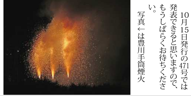
写真←は豊川手筒煙火

した。 同じまちを見ても人それぞれで、めずらしいと思うもの、面白いと思うものはみんな違うというのにはあらためて気づいて、多くの人の話が聞けたのは大きな収穫でした。成果の「手書き地図」は10月中にはネットなどでご披露できると思います。 ◇ 次回まちゼミのご案内は11月6日(日)に発行予定です。