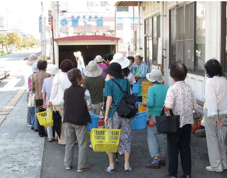
「金曜日」午後2時近く、オープンを待つお客さんが詰めかける(9/2)