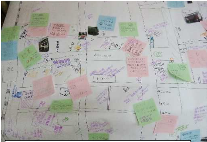
手書き地図…みんなでいろいろ書き込んだ地図(9/26)

■お店のうわさ話がいつぱい 手書き地図の講座では、中込の面白そうな場所やお店、お店の商品、料理などを話して模造紙に直接書いたり、付せんを貼ったりしました。 「やきとりが大きくて美味しい」「クレープがイチオシだよ」「ナポリタンは有名だよね」「店主はオーデオに詳しいんだよ」「近所のスー