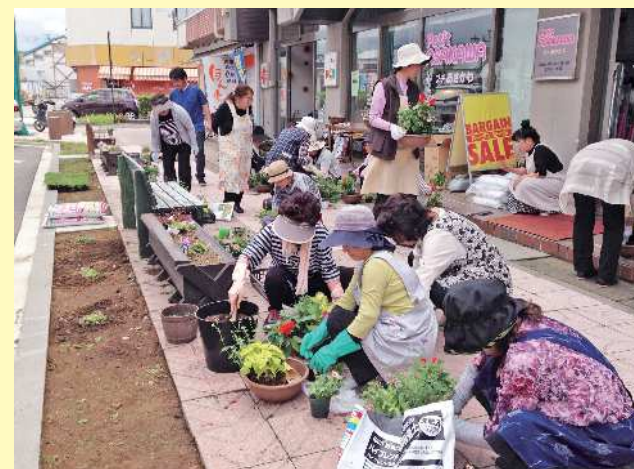
中込商店会協同組合特命宣伝部長ハイぶりっ子ちゃん

「まちゼミ」は店主や商店の取引先など、その道のプロが専門知識やコツなどを無料で提供する少人数制のゼミです。今回も高校生の講座や、店主以外のいろいろな講座もあります。愛知県岡崎市から始まったこのゼミは、お店の特徴・店主のこだわりや人柄を知ってもらい、お客様との信頼関係を築くことを目的として、全国にひろがっています。