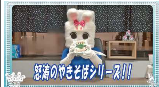
怒涛のやきそばシリーズ!!

作品を作ります。 作って楽しい、使って楽 しい、プレゼントにも最 適、世界にひとつのオリジ ナルアクセサリーでクリ エイティブな時間を楽し みましょう。