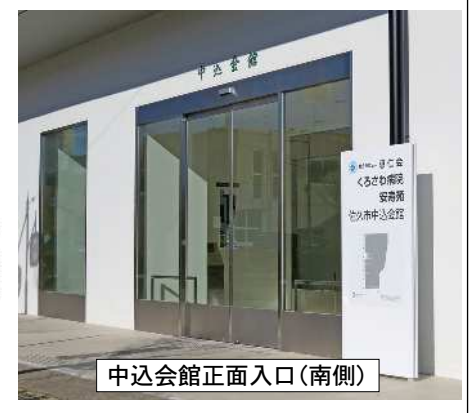
中込会館正面入口(南側)