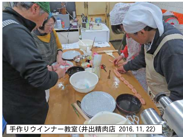
手作りウインナー教室(井出精肉店 2016. 11. 22)

ゼミがありましたら、お早めにお申し込み下さい。 ◇ ■包丁研ぎ教室 ☆包丁ときに参加させていただきました。ていねいに教えて下さり、持参の包丁を切れるようにして下さいました。本当に勉強になりました。ありがとうございます。 ◇ ■スマホ・ケータイ ☆生活に生かせる講座を企画して下さい。興味もあり、ありがたいです。