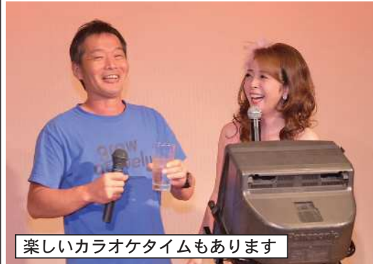
楽しいカラオケタイムもあります

中から「佐久グランドホテルさんのビアホールの季節だよ。また楽しく飲みに行きませんか」と話が出る。「じゃあ佐久グランドホテルさんに行っ