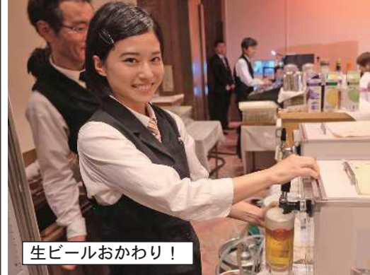
生ビールおかわり!

て思いっきり飲もうよ」と足早に向かっています。去年もそうですが飲み放題・大皿セット料理・食べ放題屋台料理で男性おひとり様5500円・女性おひとり様5000円だからかなりお得に飲んだりできますよ。佐久グランドホテルさ