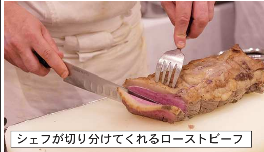
シェフが切り分けてくれるローストビーフ

んに着くとさつそく席に案内してもらいました。席に着くなり人数分の生ビールを頼み、運ばれてくると「お疲れ」と我先に飲み干す勢いで飲んでいきます。連日の暑さやスパンスーパードと忙し