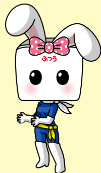
中込商店会協同組合特命宣伝部長ハイぶりっ子ちゃん

商品を守るためのイベントではありません。何か買わないと気まずいということはありませんので、お気軽にご参加ください。用事がないと入りにくいと思っていたお店にもぜひお出かけください。