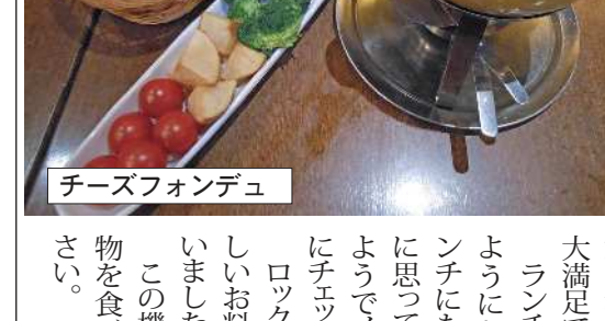
チーズフォンデュ

間に終わってしまいます。でもそのオリーブオイルを、一緒に出してくれるパんに付けて食べると自然と顔が微笑んでしまいます。美味しい。体にも良いし女性には人気の一品なんです。ビールとも合うと飲むペースもいいですね。一人の隊員はみんながそんな事をしてる間にしっかりと店内のお勧めメニューを見てネギとアンチョビのパスタ(1100円)を頼んでいました。オリーブオイルとアンチョビは