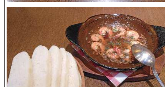
えびのアヒージョ

合わせ(2人前1100円)を見つけてそれをビールのお供にするようです。盛り合わせはライスボールなどお酒のお供に合う色々な物が盛り合わせにしてあるので嬉しいですね。野菜の大好きな隊員はお店人気のベーコンとほうれん草のサラダ(920円)を頼んでいて、来るなり直ぐに取り分け食べています。ほうれん草のシャキシャキ感とベーコンがた