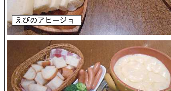
チーズフォンデュ

まらない。スライスされたニンニクがカリカリで全部の食材と混ぜて食べると間に終わっています。そうしているという匂いとともえびのアヒージョ(750円)が運ばれてきました。スペイン語でニンニク風味を表す言葉でオリーブオイルとニンニクで煮込んであるタパス。プリプリしたえびとオリーブオイルとニンニクがとも合せて絶妙に美味しい。これならどんどん食べていっちゃおうと隣く