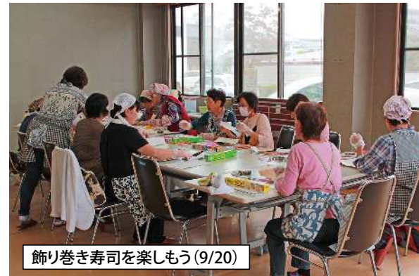
飾り巻き寿司を楽しもう(9/20)