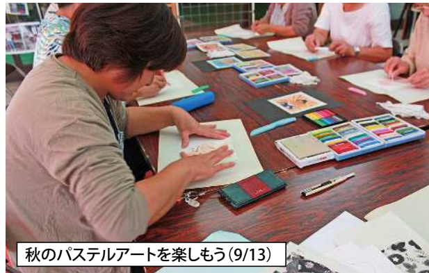
秋のパステルアートを楽しもう(9/13)