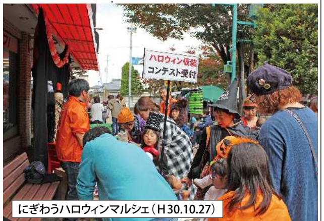
にぎわうハロウィンマルシェ(H30.10.27)