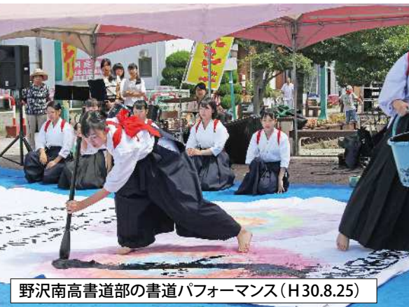
野沢南高書道部の書道パフォーマンス(H30.8.25)