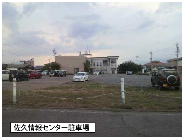
佐久情報センター駐車場