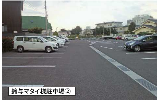
鈴与マイ様駐車場②