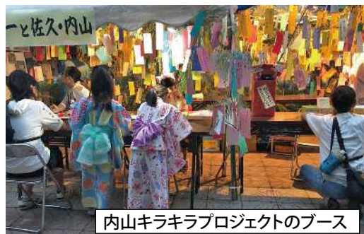
内山キラキラプロジェクトのブース