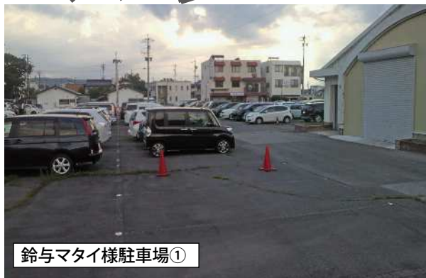
鈴与マイ様駐車場①